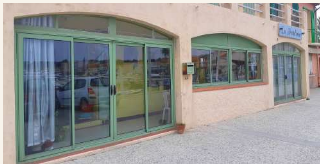
La maison familiale

Monsieur Dodero avait pour amis Monsieur Cousteau, Monsieur Bombard Alain et Aroun TAZIEFF (des scientifiques et des chercheurs).