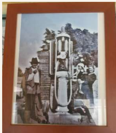
Première pompe à essence pour le pêcheur du Brus.