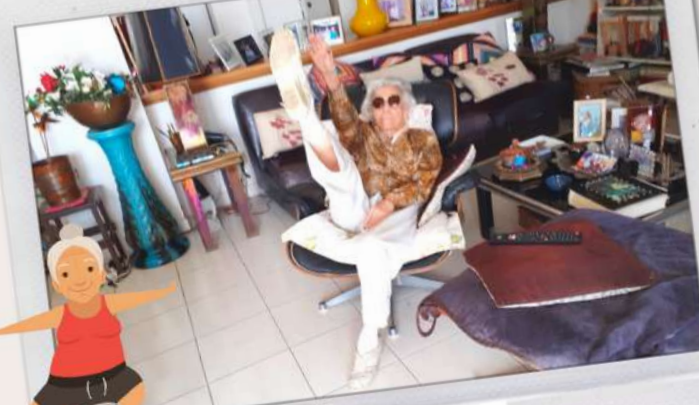
Madame P. fait ses exercices de gym comme tous les jours, une belle forme pour ses 98 printemps!