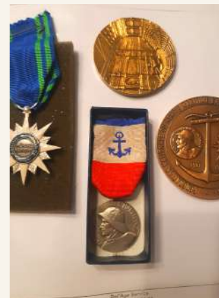
Décoration de la médaille d'honneur