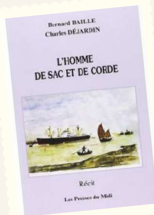
Livre écrit par Charles Dejardin et Bernard Baille