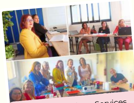
L'équipe de Belage Services de Toulon durant la formation menée par la CPAM du Var